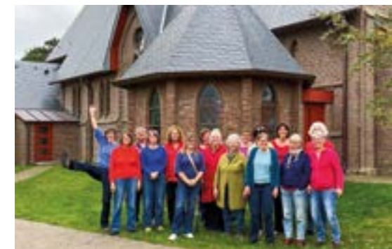
Sjans voor de Sint Clemenskerk in Nes, Ameland

Ons repertoire is divers. We zingen klassiek, musical, pop-arrangementen en Nederlandstalig. Op het moment repeteren we o.a. “Birds” van Anouk en “Hallelujah” van Leonard Cohen. Daarnaast staan onder meer liedjes van Daniël Lohues en Bløf op ons repertoire maar we hebben ook de “Cantique de Jean Racine” van Fauré gezongen. We zingen over het algemeen drie- en vierstemmig.